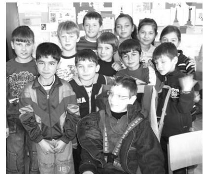
To su oni prije nekoliko godina

U prvi razred došlo je 16 različitih đaka; svaki od njih je po nečemu bio poseban i drugačiji. Ono što je meni bilo (i je) bitno, je da stvorimo zajednicu u kojoj će svatko biti važan i u kojoj će svatko imati priliku za uspjeh. I tako smo se učili međusobnom razumijevanju, prihvaćanju različitosti, poticanju,