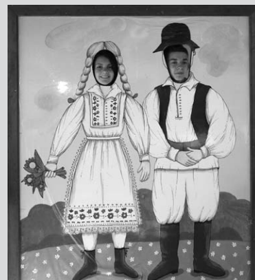
Tko se tu krije

Učenici osmih razreda posjetili su Pregradu, Veliki Tabor i Kumrovec. U Pregradi su posjetili Župnu crkvu Uznesenja BDM i muzej dr. Zlatka Dragutina Tudjina u kojem su vidjeli tri zbirke: Numizmatiku, Rudarstvo i Ljekarničku zbirku Thierry. Kasnije su posjetili dvorac u Velikom Taboru. Njega je sagradila obitelj Rattkay tijekom 16. stoljeća. I na kraju su posjetili Etno-selo Kumrovec. U Kumrovcu su posjetili kuću Josipa Broza Tita, kao i mnoge stare kuće. Uz novo stečeno znanje, lijepo i veselo su se vratili kući.