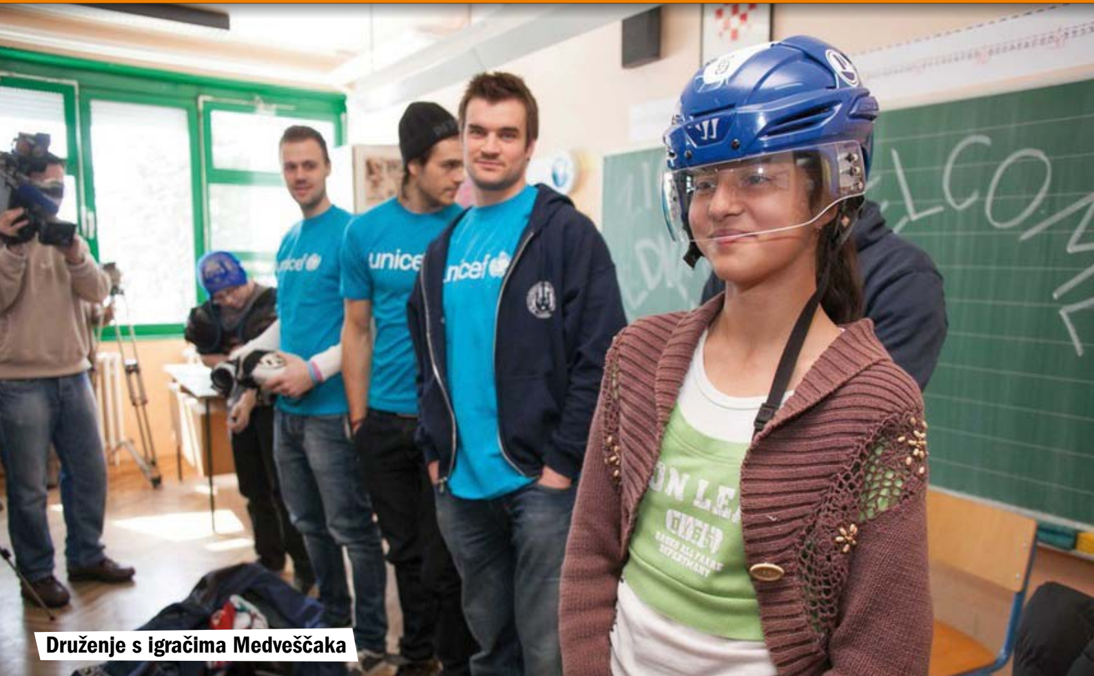
Druženje s igračima Medveščaka

List učenika OŠ dr. Ivana Novaka Macinec · rujan 2013. · ISSN 1333-5367 · broj 15 · cijena 15 kn