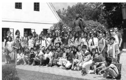
U Kumrovcu na okupu

9. svibnja učenici 5. i 6. razreda posjetili su Kumrovec i Trakošćan. Učenike na izlet osim učitelja pratili su i vodiči koji su učenicima pojašnjavali sve što je bilo potrebno. U Kumrovcu su svi učenici mogli vidjeti kuću Josipa Broza Tita. U njegovoj kući vidjeli smo namještaj, sobe, kuhinju i samim tim sve predmete koji