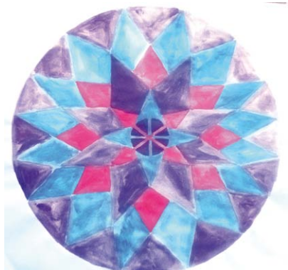
Anja Škvorc, 8. a