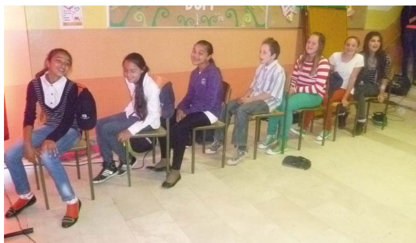
5.b i 5.c - Naša učiteljica je...