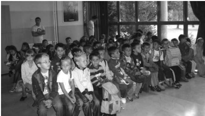
Prvšaći na priredbi dobrodošlice

Tek su nedavno stigli u školske klupe, a već su puno svega naučili. Škola im je drugi dom pa su joj posvetili i nekoliko rečenica.