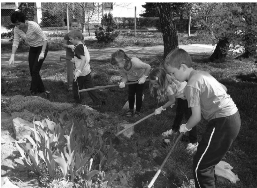
Sami uređujemo kamenjar. Lijepo je živjeti i raditi u urednom i lijepo uređenom okolišu.