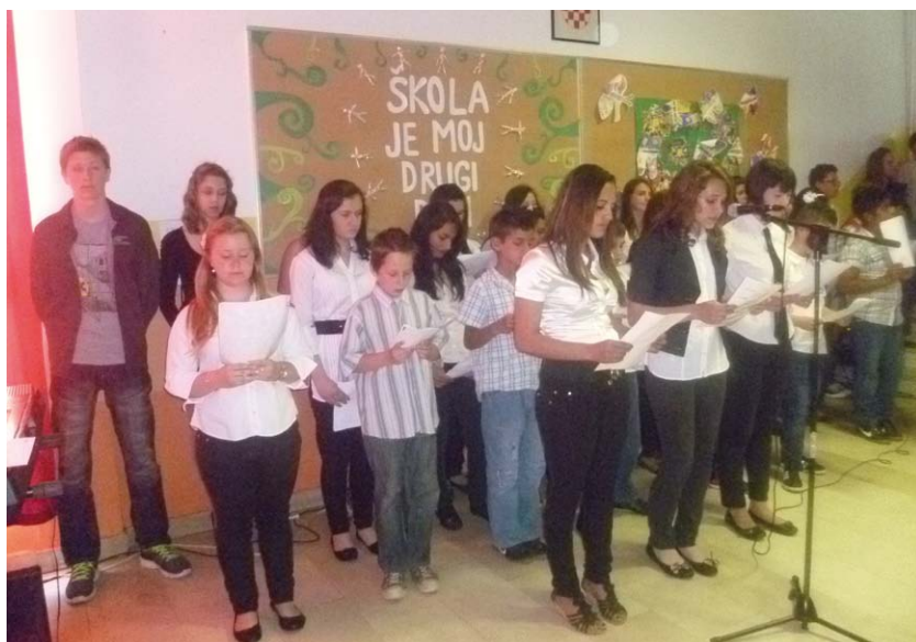
Veliki zbor i solistice