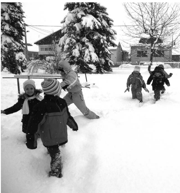
Tjelesne aktivnosti na snijegu.