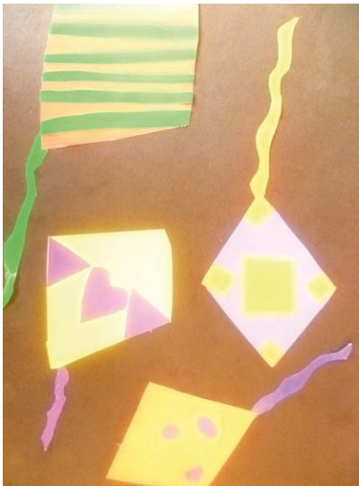
Dolores Lovrenčić, 3. a