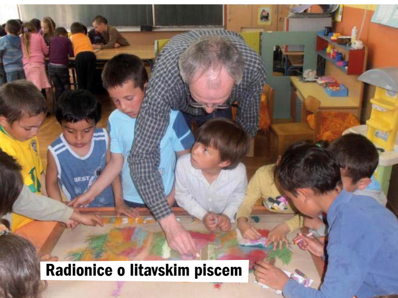
Radionice o litavskim piscem