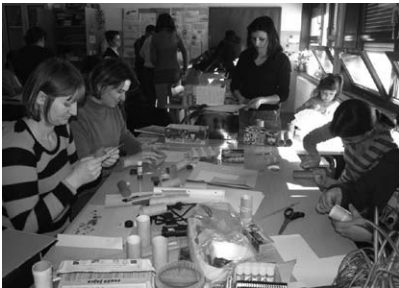
Kreativnost roditelja na radionicama