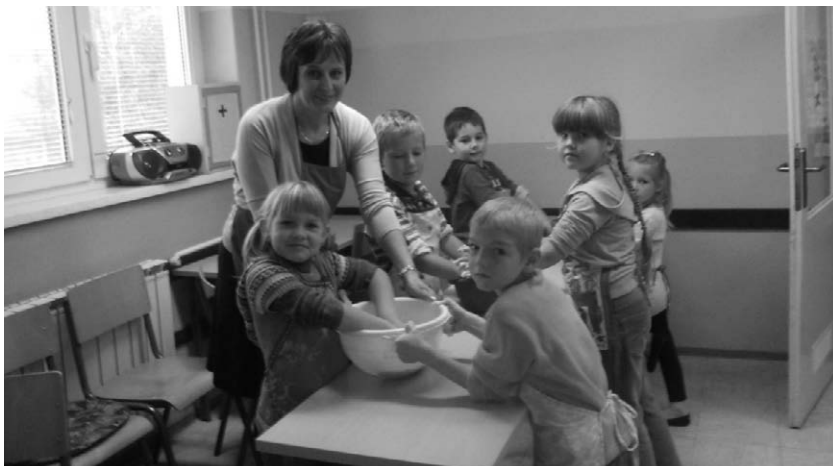
Sami uređujemo kamenjar. Lijepo je živjeti i raditi u urednom i lijepo uređenom okolišu.