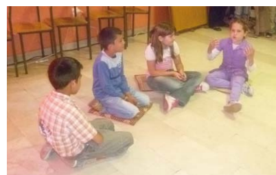
Igrokaz dramske grupe