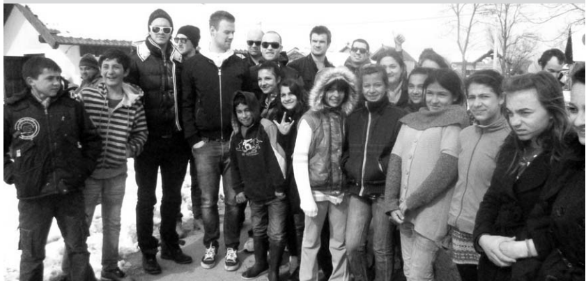
Hokejaši u Paragu