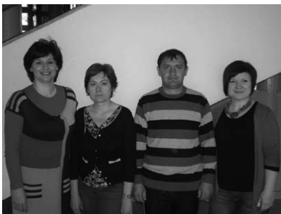
Voditelji radionica na okupu

U protekle dvije godine, Pučko otvoreno učilište "Korak po korak" iz Zagreba u suradnji s tri međimurske osnovne škole provodilo je projekt "Pružanje podrške roditeljima romske nacionalnosti u odgoju i obrazovanju njihove djece". Naša škola aktivno se uključila se u provođenje projekta te ga uspješno okončala u travnju ove godine.