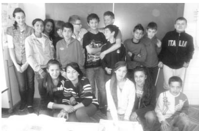
Poseban razred - 6.a

Postoji jedan razred sasvim običan, ali vrlo poseban. Krasi ga zajedništvo i međusobno pomaganje učenika dviju različitih nacionalnosti. Od 1. razreda zajedno sjede u klupama, potiču i hrabre jedni druge. Sada su već malo veći, ali zajedništvo među njima ostalo je i dalje nepromjenjivo. Najvjerniji prikaz svojeg školskog života izrazili su oni sami, a i njihovi razrednici, bivši i sadašnji. Ovo je priča o 6. a razredu.