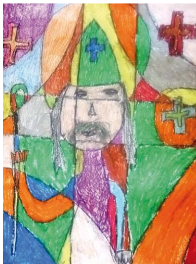
Valentino Treska, 4. a