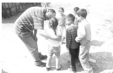
To je naš učitelj!