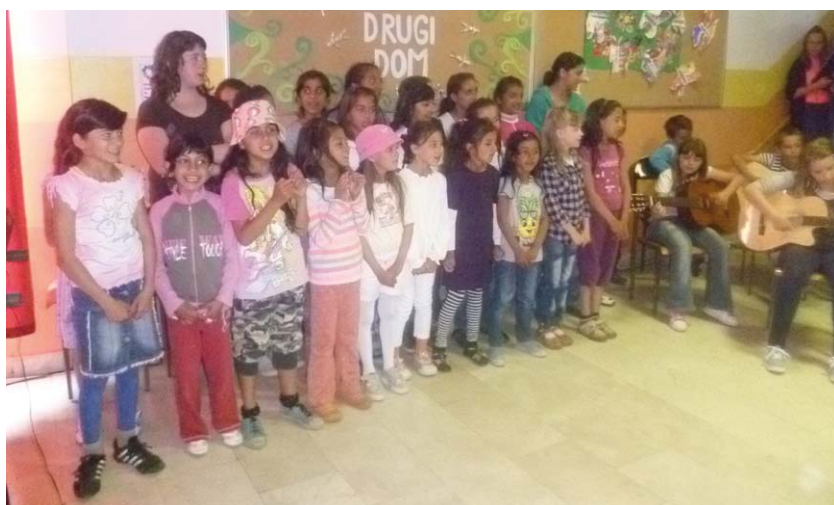
Priredbu je otvorio Mali zbor