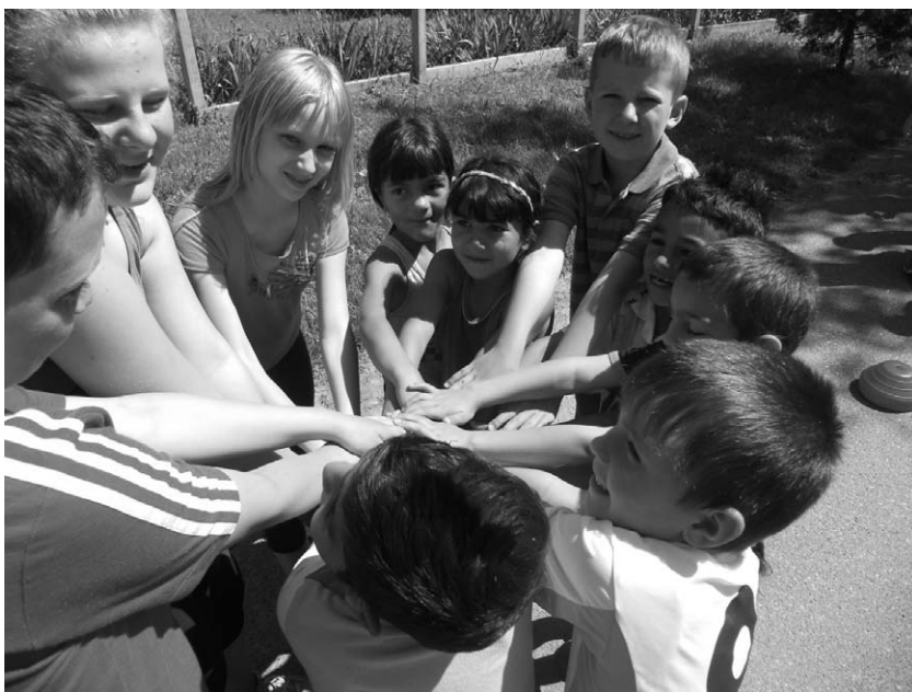
Dan sporta. Lijepo je biti različit.