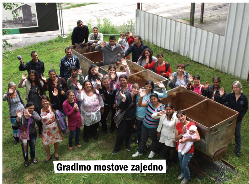
Gradimo mostove zajedno