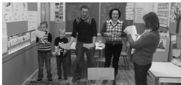
Druženje roditelja i djece: uvažavanje različitosti, tolerancija.