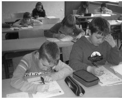
Klokan za pametne glavice

Pod pokroviteljstvom Ministarstva znanosti, obrazovanja i športa i Hrvatskog matematičkog društva 21. ožujka 2013. godine održano je po 15. put Međunarodno matematičko natjecanje "Klokan bez granica", a sudjelovalo je 54 učenika naše škole. Prošle godine u isto vrijeme s približno