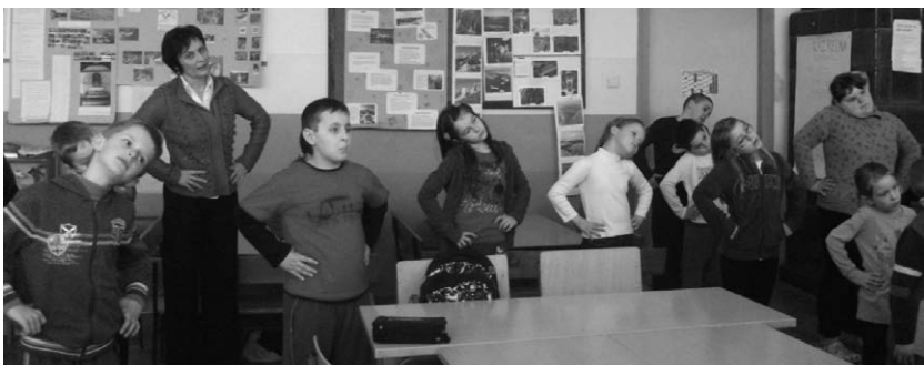
Tjelovježba prije početka nastave.