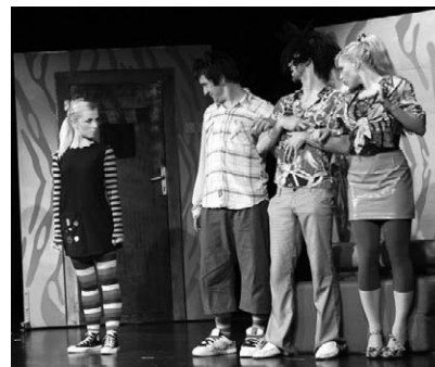
Prizor iz predstave Matilda

Ova predstava zapravo govori o onome što već dugo muči najmlađe – njihovi roditelji koji su zaokupljeni poslom. Na sreću, ovo je priča sa sretnim završetkom. Ono što ne dobiva u obitelji, Matilda će pronaći u liku učiteljice. I tu počinje jedna nova priča o razumijevanju, potpori i ljubavi.