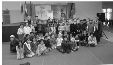
Učenici posjetili Mesap Libar

Učenici od 1.do 3. razreda posjetili su u petak, 12. 4. 2013. Mesap "Libar" u Nedelišću. Prisustvovali su književnom susretu sa Željkom Horvat-Vukelja. Književnica je pričala svoje priče na zabavan i zanimljiv način pa je susret protekao u smijehu i veselju.