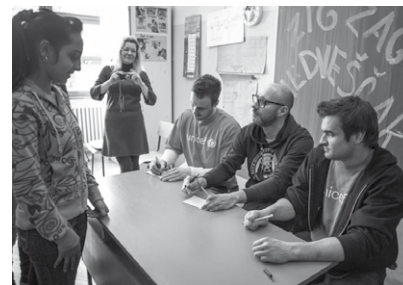
Svi smo htjeli autograme