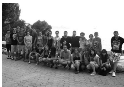
Maturalac za pamćenje

Drugi dan smo posjetili predivan grad Dubrovnik, i nakon vraćanja u hotel imali svoj vlastiti disko gdje smo ostali do kasno, upoznavali nove prijatelje i stekli nove ljubavi. Treći dan posjetili smo rijeku Neretvu i vozili se brodićima,