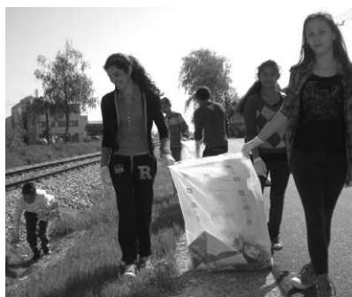
Vrijedni sedmaši u akciji