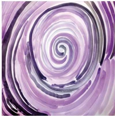
Snježana Balog, 6. e