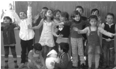
U Maloj školi slavimo Dan Roma

Polaznici Male škole u prijedpodnevnim su satima otputovali u Čakovec na svečano obilježavanje Dana Roma u Centru za kulturu. Nazočili su dječjoj predstavi Kazališne družine Pinklec pod nazivom „A tko si ti?“. Nakon toga su se vratili u Gornji Hrašćan gdje su upriličili priredbu za svoje roditelje. U njihovoj svečanosti sudjelovali su i učenici Područne škole 1.-4. razreda. Nakon prigodnog programa uslijedilo je čašćenje i druženje s roditeljima.