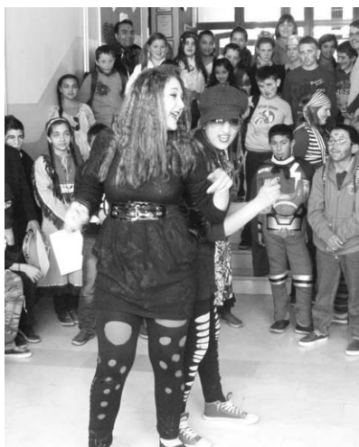
Pobjednice u izboru naj maske

Maškare su u našem zavičaju jako lijepe, smijemo se maskama. Čovjek može postati ono što želi biti u stvarnosti. Ja jako volim maškare. Ove godine mi je bilo jako lijepo. U školi smo održali program na kojem se obično učenici natječu za najbolje maske. Puno smo se smijali. Učenici su nam se predstavili i glumili ono što ta maska radi. Neki su se jako potrudili pa su pobijedili i dobili nagradu - čokoladu. Mislim da će i iduće godine biti lijepo i zabavno. Svi ćemo se opet puno smijati smiješnim maskama.