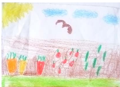
Matea Balog, 1. a