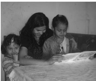
Rad roditelja i djece kod kuće

Projekt je obuhvatio roditelje djece koja polaze program Predškole. Okupili smo dvije grupe roditelja, ukupno njih 32. Svaka grupa jednom tjedno dolazila je na radionice koje su provodili učiteljica Vesna Perhoč, ravnateljica Božena Dogša, defektologinja Simona Borko te romski pomagač Danijel Bogdan. Voditelji radionica poučavali su roditelje kako mogu pomoći svojoj djeci u savladavanju predčitalačkih i predmatematičkih vještina te pisanju domaćih zadaća. Osim toga, na svakoj radionici obrađivali su odgojne teme: komunikacija s djetetom, koncept nagrade i kazne, briga o zdravlju djeteta, odnosi u obitelji i sl. Najveseliji dio svake radionice definitivno je bila pauza, kada su