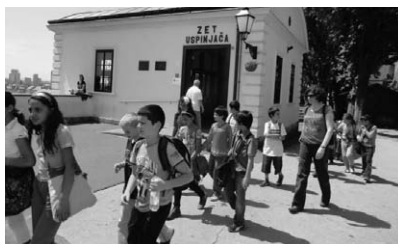
Vozili smo se uspinjačom

Posjetili smo Hidrometeorološki zavod i tamo vidjeli kako se rade prognoze vremena. Vidjeli smo Crkvu svetog Marka koja nam se zbog šarenog krova jako sviđala. Šetali smo tržnicom. Bili smo i u Katedrali. Unutra je bilo jako lijepo. Bili smo i na Bundeku. Tamo smo si kupili sladoled, a zatim smo se lijepo igrali ljuljali, penjali, pri-