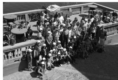
Škola u prirodi

Poslije jutarnje tjelovježbe i doručka, krenuli smo autobusom na otok Krk. Brodom smo se vozili na drugi otok. Tamo smo posjetili samostan i muzej. Vratili smo se na otok Krk i vidjeli crkvu sv. Lucije u Jurandvoru gdje je pronađena Bašćanska ploča. Zatim smo išli u razgledavanje špilje Biserujke. Nakon večere išli smo se natjecati s drugom školom u graničarima i nogometu. Dečki su u nogometu pobijedili,