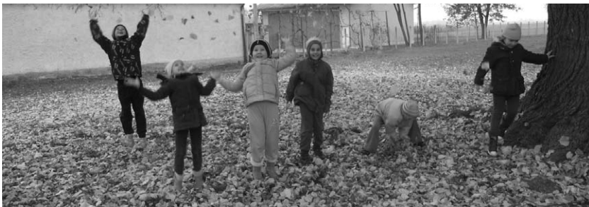
Tjelesna aktivnost u dvorištu, u prirodi