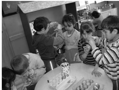
Zaposleni predškolci u uskršnjoj radionici