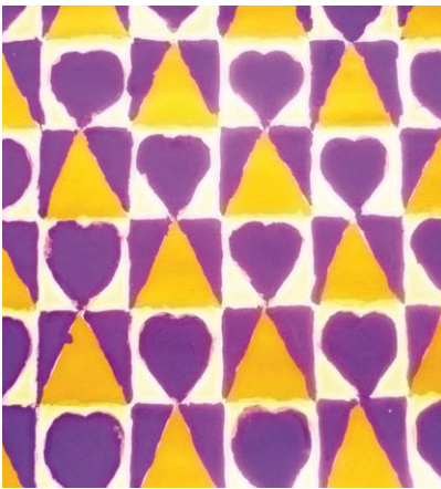
Melita Oršoš, 7. a