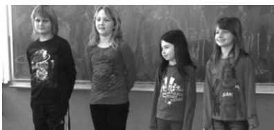
Recitatori iz G. Hrašćana priključili se proslavi

I učenici niže smjene sa svojim učiteljima i učiteljicama marljivo su se pripremali da bi toga dana mogli pokazati što sve znaju. Na početku programa je, kao i uvijek, nastupio mali zbor pod vodstvom učitelja Igora Pergara, koji je izveo niz veselih dječjih pjesmica. Svoja umijeća pokazali su i mali lutkari i recitatori izvevši nekoliko zabavnih i poučnih igrokaza: Majmun Tomo, Mudra žaba, Kako je izabran kralj šume, Zaboravna vjeverica, Bajka o prijateljstvu i Dječja prava. Po završetku programa škola ih je sve počastila slatkišima, i izvođače i gledatelje.