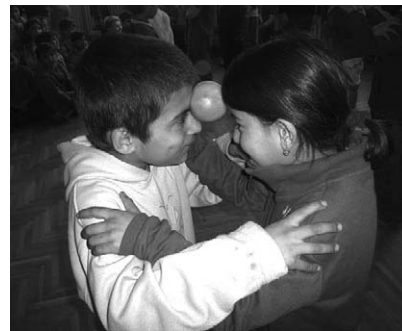
Ples s jabukama

Taj dan obilježava se jedan dan u listopadu. Učenici pripremaju kratak program, a nakon toga blaguju kruh koji su samo za njih ispekli njihove mame, bake, a možda čak i sami. Osim blagovanja, učenici na satu hrvatskog jezika pokojim retkom izrazili i svoje misli vezane uz važnost kruha. U nastavku donosimo kratak sastavak.