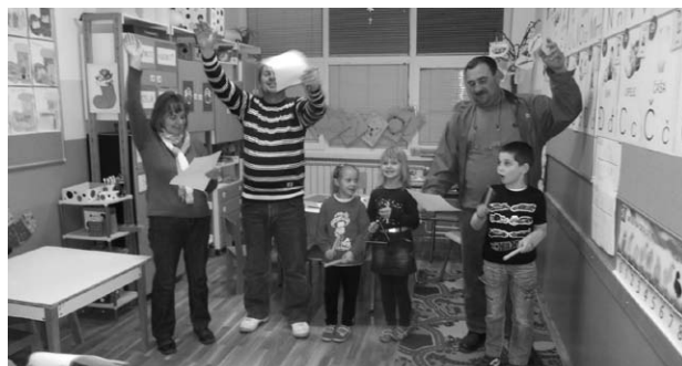
Radionice roditelja i djece: Pravilna prehrana.