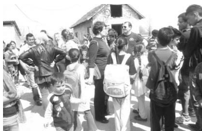
Učitelji u Paragu